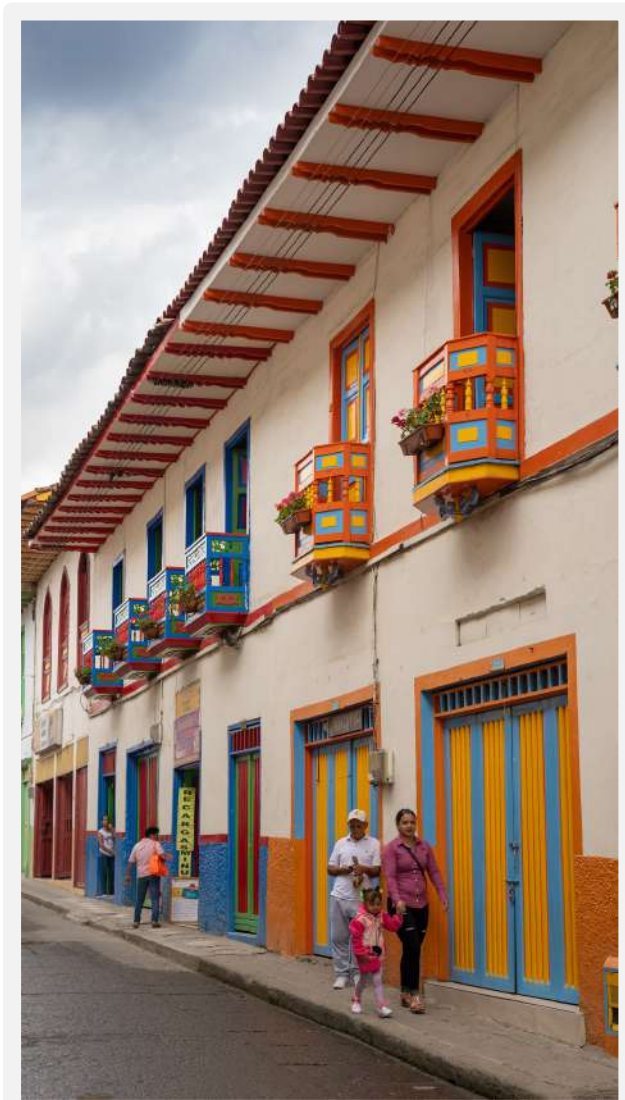
Municipio de Santuario Departamento de Risaralda